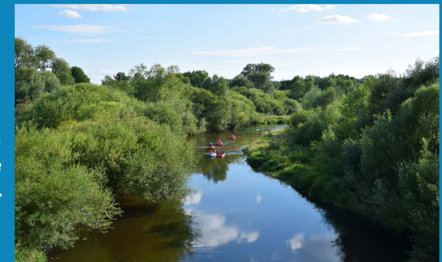
Bóbr - Prkoszów, most

Płynie w kierunku północno-zachodnim doliną o krętym przebiegu. Od źródeł płynie ku północnemu wschodowi przez Lubawkę i Kamienną Górę leżące w Kotlinie Kamiennogórskiej. W Marciszowie skręca ku północnemu zachodowi. Za Ciechanowicami skręca na zachód i przedziera się głęboką, przełomową doliną między Rudawami Janowickimi a Górami Kaczawskimi, która kończy się w Janowicach Wielkich. Przecina północną część Kotliny Jeleniogórskiej. Za Jelenią Górą skręca na północny zachód i wpływa w drugi przełomowy odcinek (Borowy Jar) między Pogórzem Izerskim a Górami Kaczawskimi. W Pilchowicach skręca na północ. Dalej dolina zwęża się i rozszerza, oddzielając Pogórze Izerskie od Pogórza Kaczawskiego, później przecina Bory Dolnośląskie, Wał Trzebnicki, Obniżenie Milicko-Głogowskie, Wzniesienia Zielonogórskie i dolinę środkowej Odry. Uchodzi do Odry w okolicach Krosna Odrzańskiego.