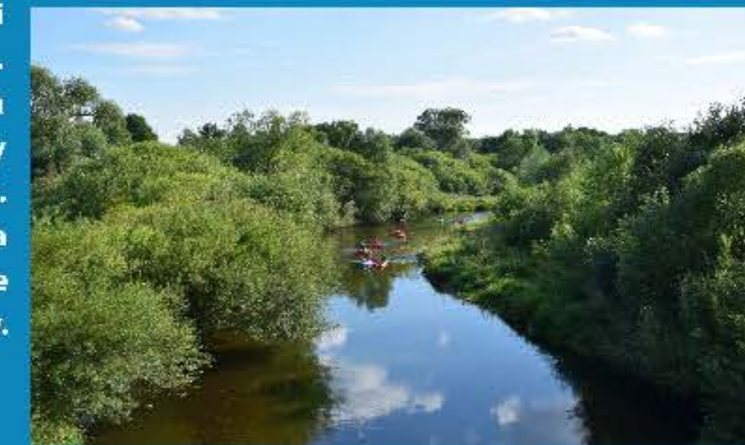
Bobr - Kraszowice, most

Płynie w kierunku północno-zachodnim doliną o krętym przebiegu. Od źródeł płynie ku północnemu wschodowi przez Lubawkę i Kamienną Górę leżące w Kotlinie Kamiennogórskiej. W Marciszowie skręca ku północnemu zachodowi. Za Ciechanowicami skręca na zachód i przedziera się głęboką, przełomową doliną między Rudawami Janowickimi a Górami Kaczawskimi, która kończy się w Janowicach Wielkich. Przecina północną część Kotliny Jeleniogórskiej. Za Jelenią Górą skręca na północny zachód i wpływa w drugi przełomowy odcinek (Borowy Jar) między Pogórzem Izerskim a Górami Kaczawskimi. W Pilchowicach skręca na północ. Dalej dolina zwęża się i rozszerza, oddzielając Pogórze Izerskie od Pogórza Kaczawskiego, później przecina Bory Dolnośląskie, Wał Trzebnicki, Obniżenie Milicko-Głogowskie, Wzniesienia Zielonogórskie i dolinę środkowej Odry. Uchodzi do Odry w okolicach Krosna Odrzańskiego.